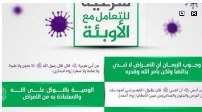
E l'Isis fa la sua guida anti-contagio e invita i suoi a non andare nelle aree infette