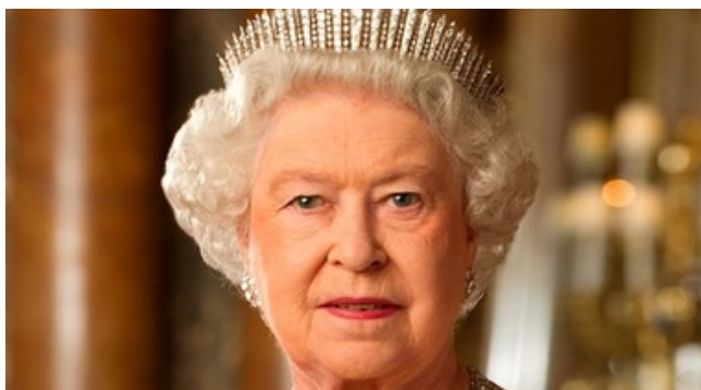
La Regina Elisabetta parla alla Nazione: «Il mondo entra in un periodo di incertezza»