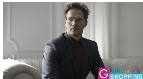
Profumo da uomo, ecco la top 5 delle migliori fragranze